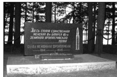
Мемориал в г. Сестрорецке, посвящённый зенитчицам