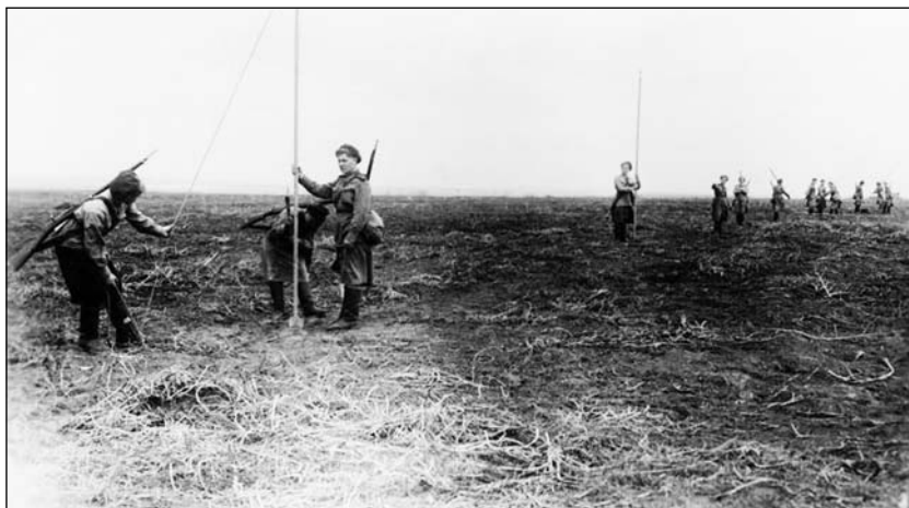
Практическое занятие кабельно-шестовой роты Отдельного учебного батальона связи